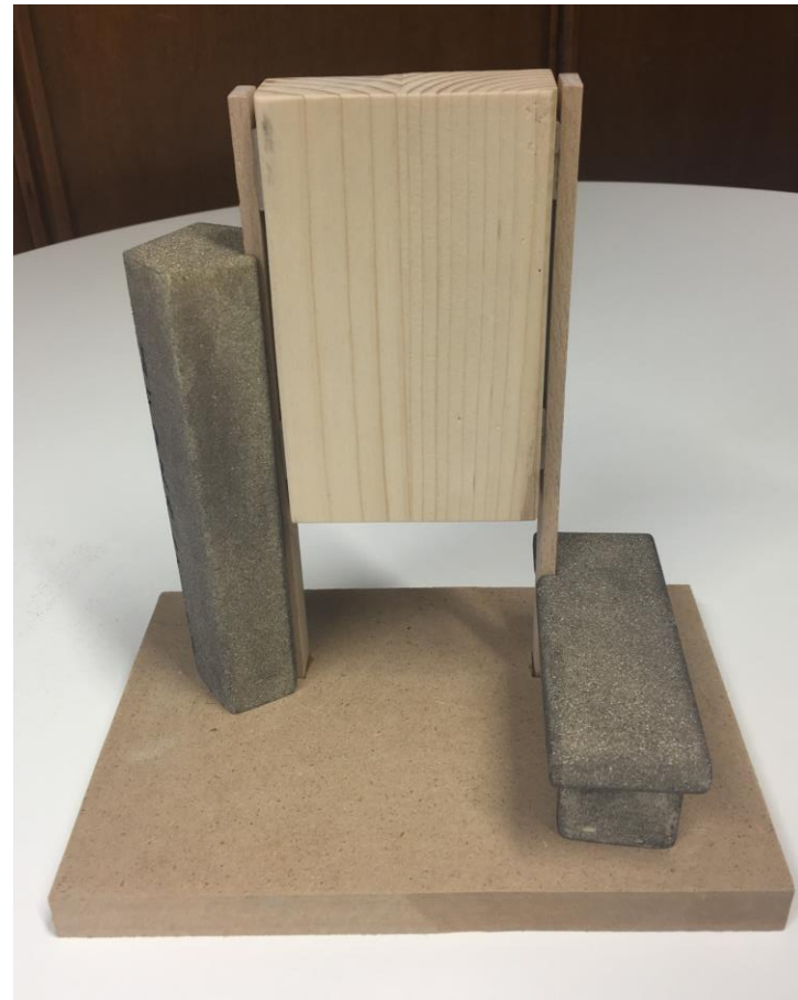
Modell Verkleidung mit Naturstein